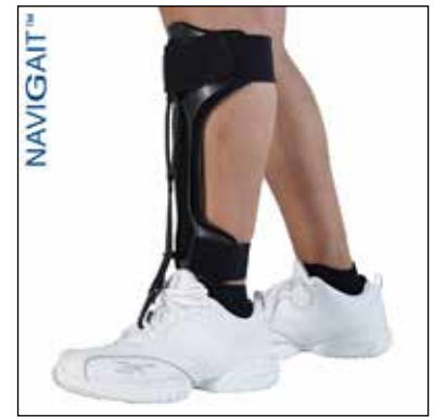
Mått: Plastdelens längd