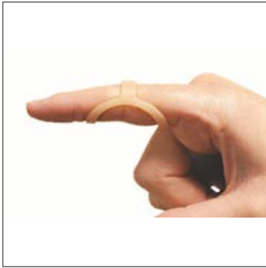
Mått: Omkrets fingerled