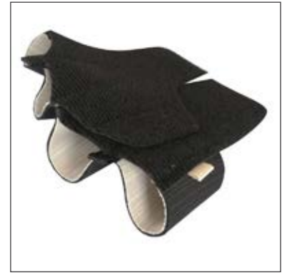
Mått: Omkrets MCP 2-5