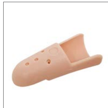
Mått: Omkrets PIP-led