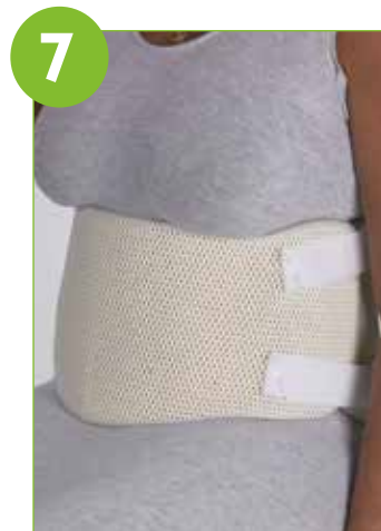
Kontrollera passformen i stående och sittande.