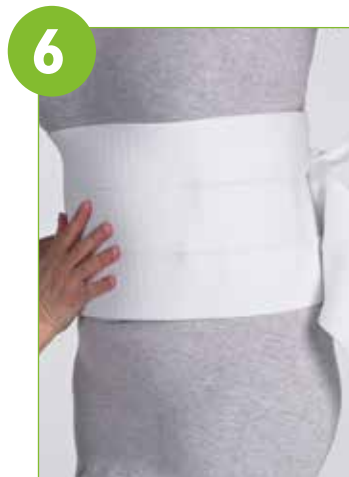
Applicera den elastiska bindan eller resårgördeln över båda sektionerna tills dom stelnat.